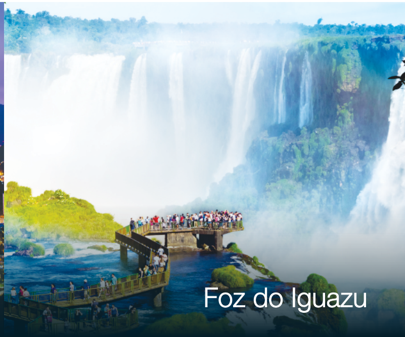
Foz do Iguazu